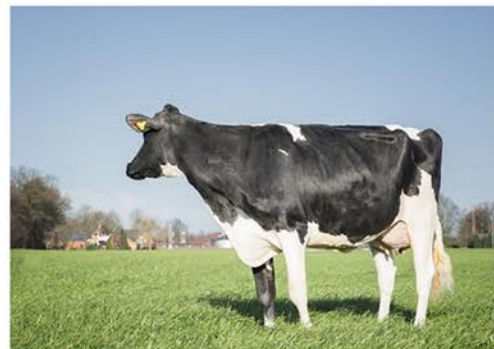
WILDER HIRA VG85

MISSION P ET X WILDER HERZ P ET (POWERBALL P) X WILDER HIRA VG85 (SALOON) X KONNY 14 VG85 (SNOWMAN) X CCC KONNY VG87 (GOLDWYN)