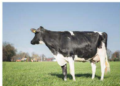
WILDER HIRA VG85

MISSION P ET X WILDER HERZ P ET (POWERBALL P) X WILDER HIRA VG85 (SALOON) X KONNY 14 VG85 (SNOWMAN) X CCC KONNY VG87 (GOLDWYN)