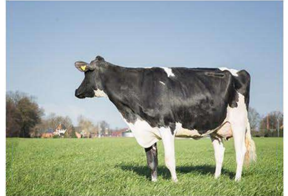
WILDER HIRA VG85

MISSION P ET X WILDER HERZ P ET (POWERBALL P) X WILDER HIRA VG85 (SALOON) X KONNY 14 VG85 (SNOWMAN) X CCC KONNY VG87 (GOLDWYN)