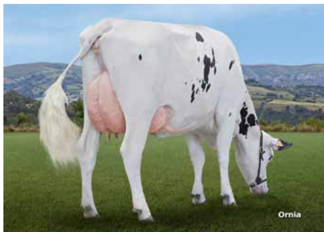
EL HAYA NISSAN ROSI (MB-85), El Haya Matienzo, C.B. - Bizkaia