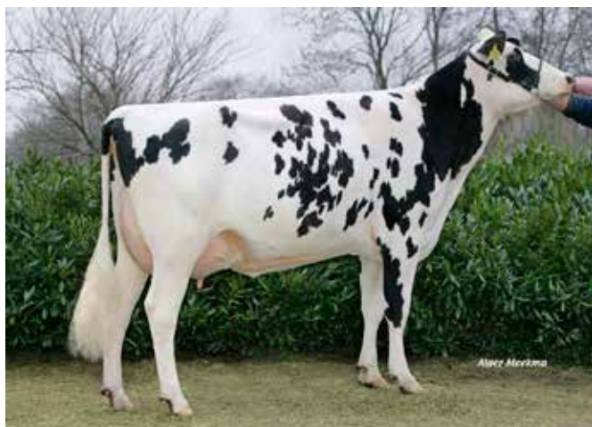
TABEA ET (VG-85). Madre de ASTRAKAN