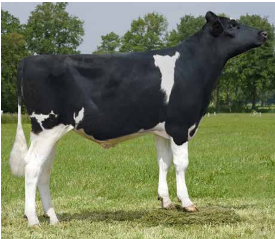
Gefri GAVILÁN PC ET es el número 1 en España de los sementales polled con capa blanca y negra.

Estos cuatro nuevos animales también disponen de valoración genética GTPI, GLPI y RZG.