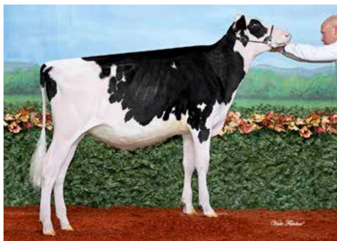
FLEURY DOUGLAS LISALY. Fleury Holstein - Quebec (Canadá)